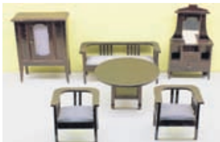
Wohnzimmer. Stilvolle Möblierung für eine Puppenstube.

Spielzeugmuseum Riehen, Baselstrasse 34, Täglich offen 11–17 Uhr, Di geschlossen.